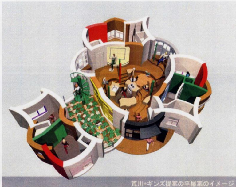
荒川+ギンズ提案の平屋家のイメージ

今回見学のモデル住宅は、愛・地球博の開催に合わせて、名古屋市と名古屋市住宅供給公社が、養老天命反転地の設計で知られている荒川修作+マドリンギンズの提唱する 宿命反転住宅 と環境首都を目指す名古屋市にふさわしい環境配慮の循環型タウンハウスです。設計・施工は公募型企業開発提案方式で選定された徳倉建設が行っています。