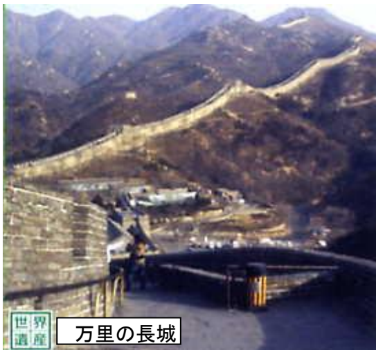
世界遺産 万里の長城