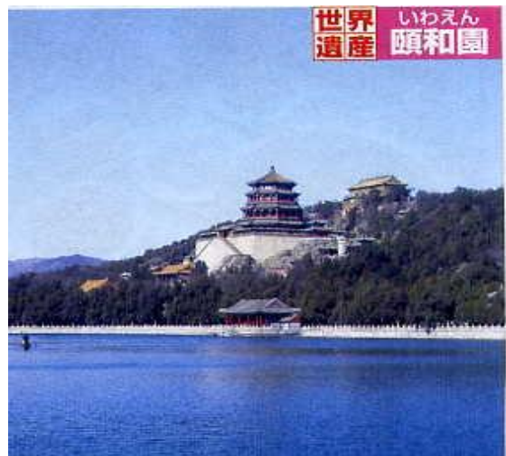
世界遺産 いわえん 頤和園