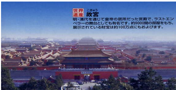
世界遺産 故宮 こきゅう 明・清代を通じて皇帝の居所だった宮殿で、ラストエンペラーの舞台としても有名です。約9000間の部屋をもち、展示されている財宝は約100万点にもおよびます。