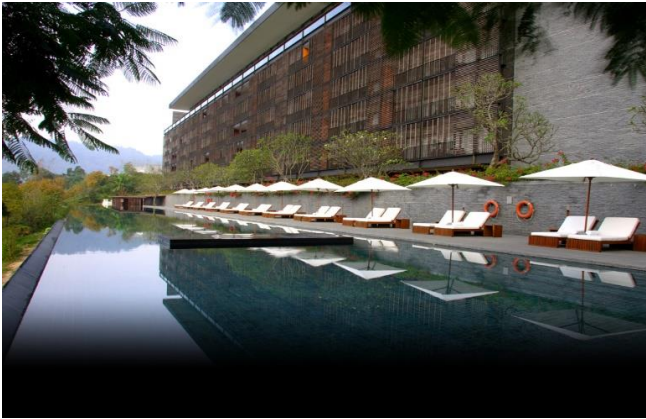
ホテル「ラルー」 ケリー・ヒル (Kerry Hill) 設計 (オーストラリア)

(一社) 日本建築協会東海支部 台湾研修旅行 2016年11月3日(木)～6日(日) 募集人員20名程度 募集締め切り8月31日