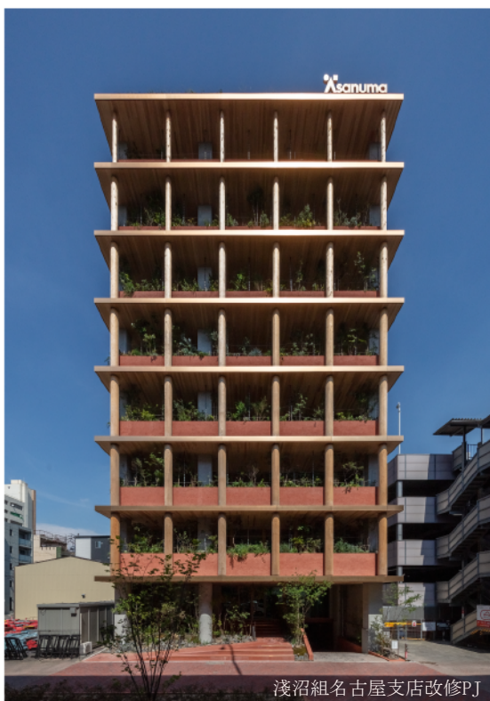
浅沼組名古屋支店改修PJ