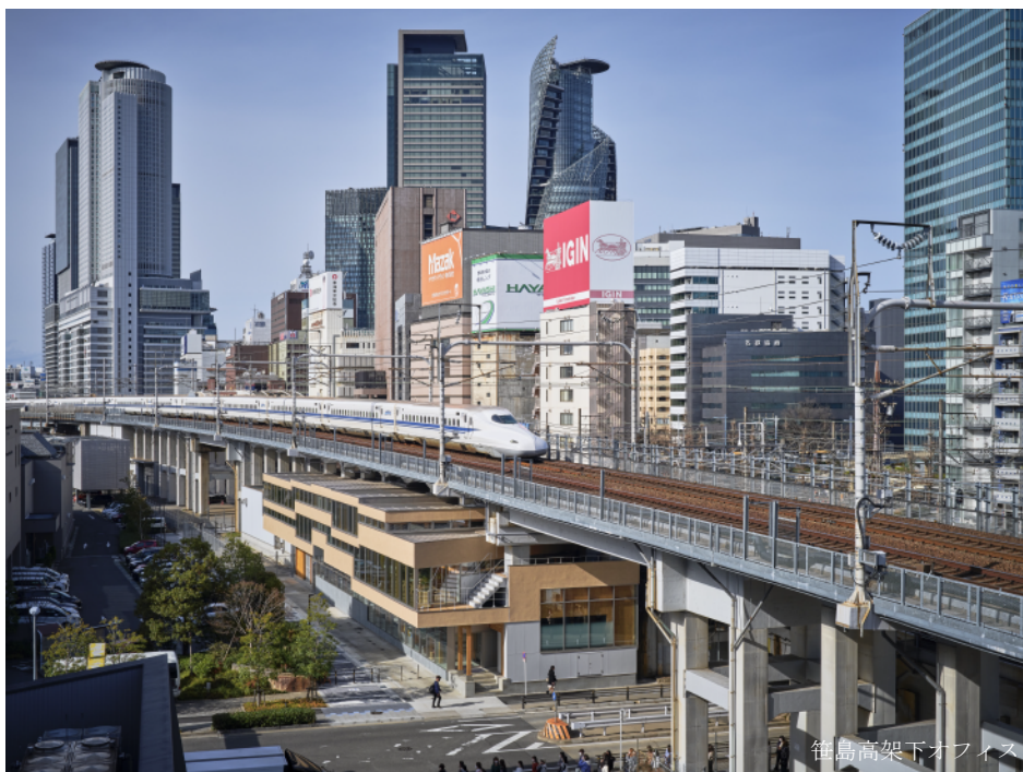
笹島高架下オフィス