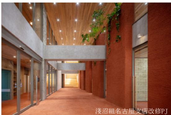
浅沼組名古屋支店改修PJ