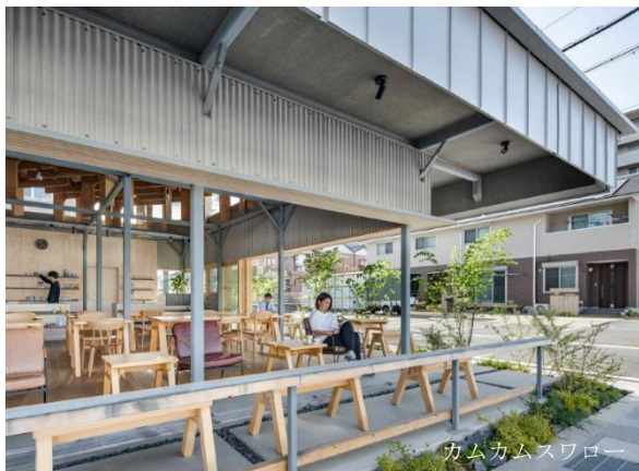
カムカムスワロー