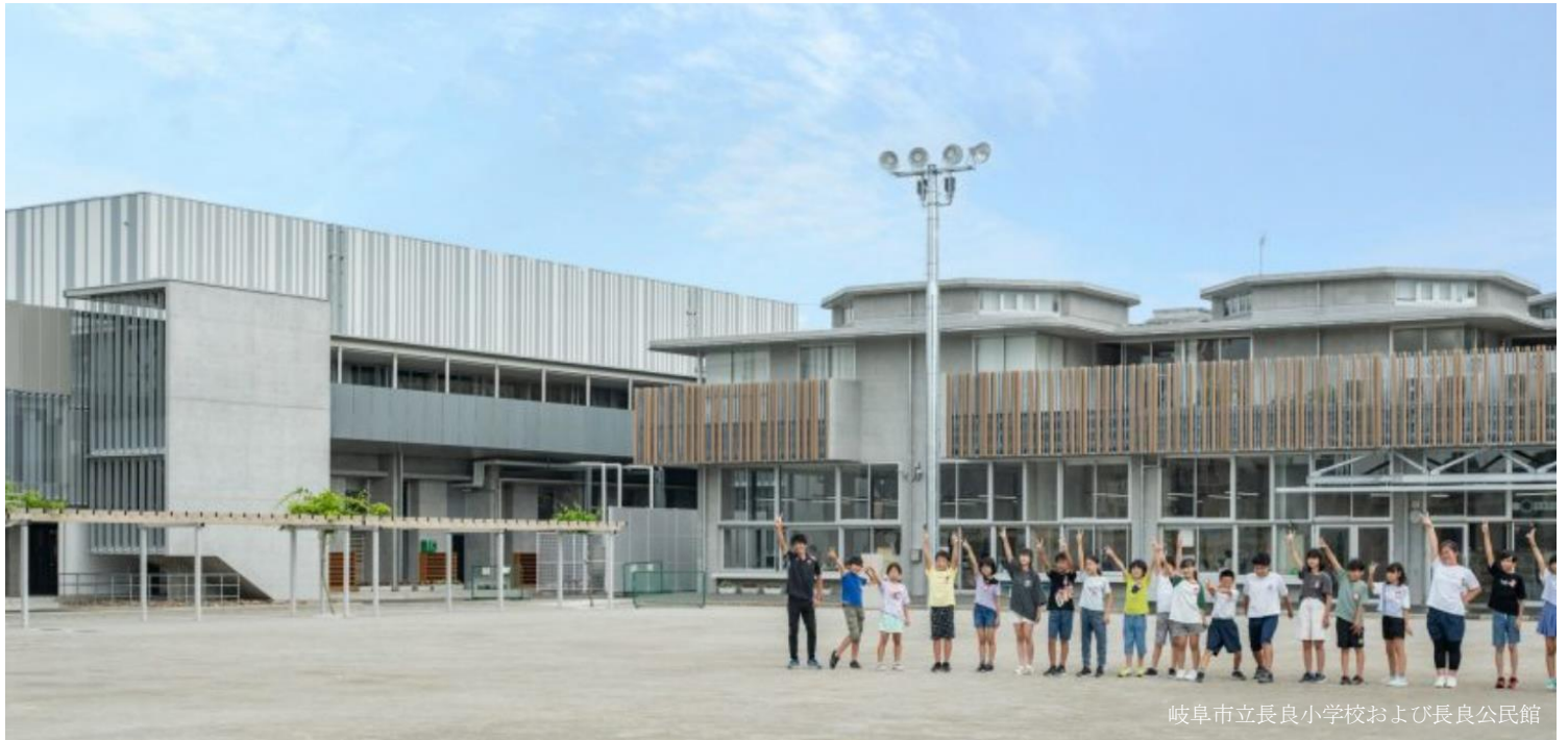
岐阜市立長良小学校および長良公民館