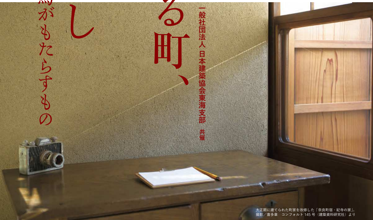
大正期に建てられた町家を改修した「奈良町宿・紀寺の家」。

つい30年くらい前まで、日本の壁といえは左官の壁だった。庶民の家もお金持ちの家も、そば屋も旅館も、学校や役所だって、左官が壁を塗っていた。それらが急速に姿を消していった。多くの左官は廃業し、後継者はいなくなっていく。はたして、左官はもう終わりなのか？日本人はもう左官を必要としていないのか？日本左官会議ならではの前代未聞の講演会、全国キャラバンの名古屋編です。